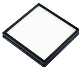
図1 面光源 1)

自動車のボンネットやバンパーは曲面形状が多いため、検査官による最終検査が必要である。しかしながら、バンパーやドアの塗装に対しては、複数の検査官による品質チェックを行っているが、見落としやクレームによる塗り直しが発生しており、同時に検査官にも大きな作業負荷を与えている。