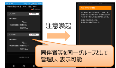
図3：安心モニタリング機能例