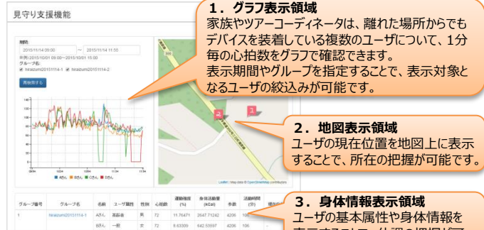
図4：見守り支援機能例