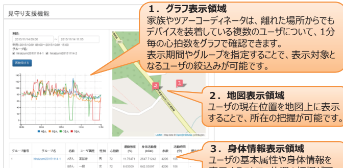
図4：見守り支援機能例